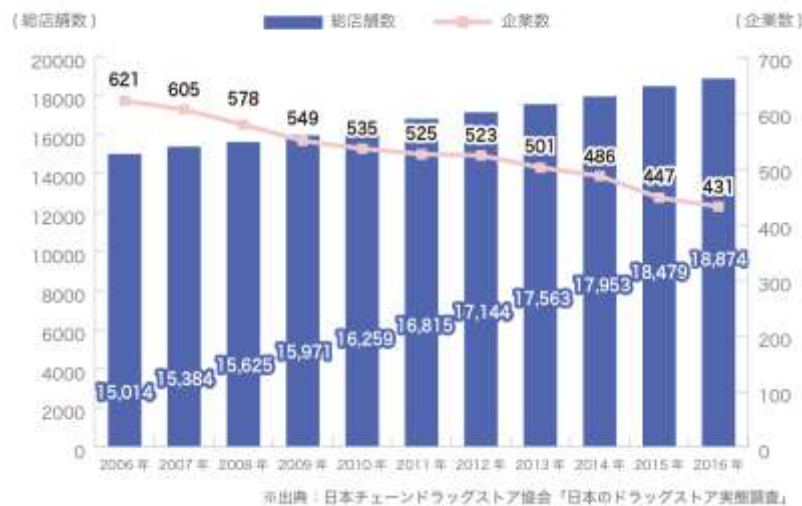
【全国ドラッグストア総店舗数】